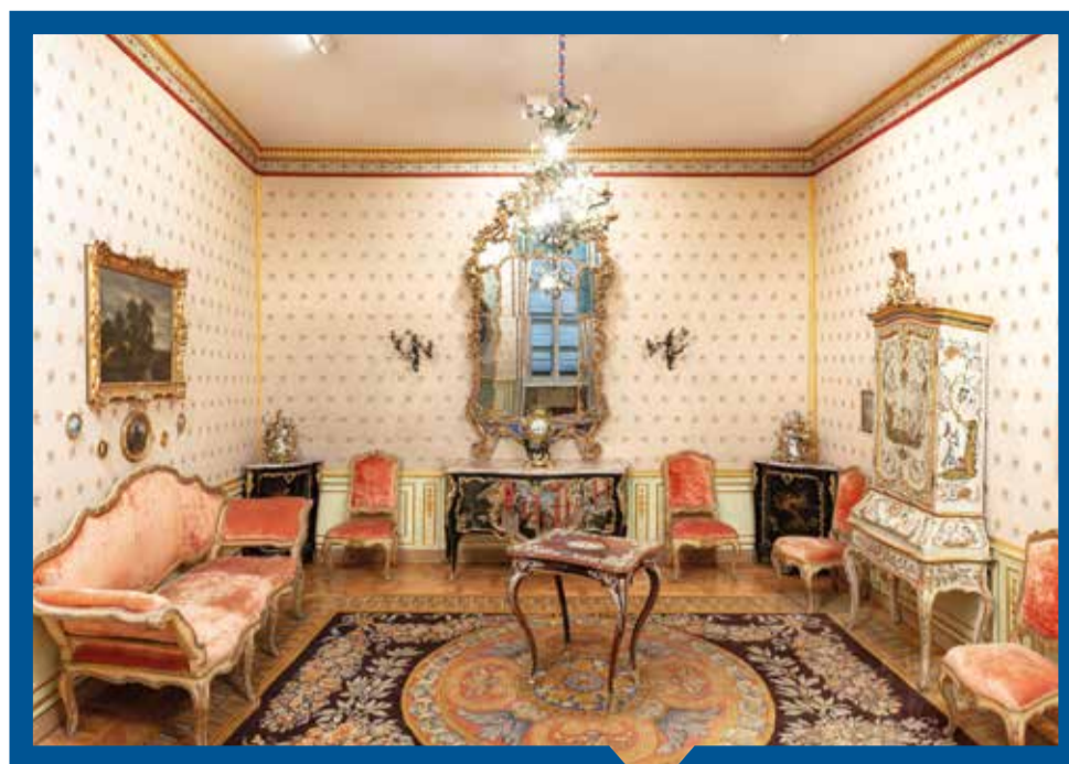
12 Salotto Luigi XV